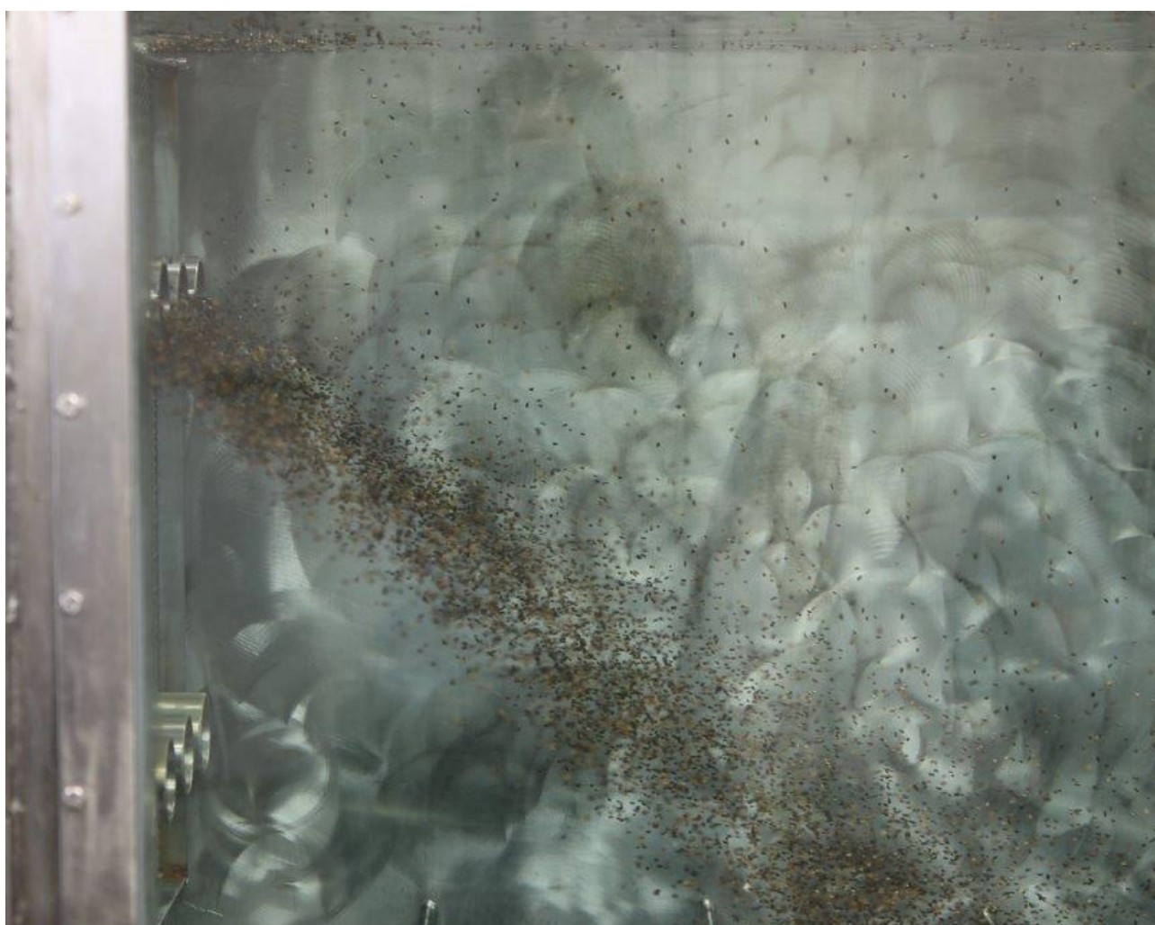
Granfrö i IDSrännan för vitalisering och bortrensning av dåligt frö.